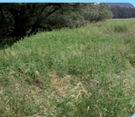
Abb. 24: Beobachtungsfläche nach der Behandlung mit Glyphosat 2004, natürlicher Gräserbestand, Landkreis Löbau-Zittau, September 2006

Diese Genehmigungen erteilt in Sachsen die Sächsische Landesanstalt für Landwirtschaft, Fachbereich Pflanzliche Erzeugung, Referat Pflanzenschutz.