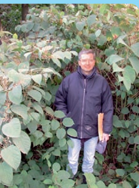
Abb. 3: Etwa 2,5 m hoher Staudenknöterichbestand