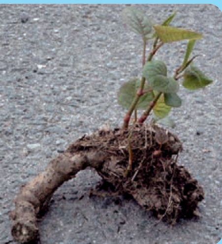
Abb. 8: Aus Knospen am Rhizomfragment können neue Sprosse austreiben