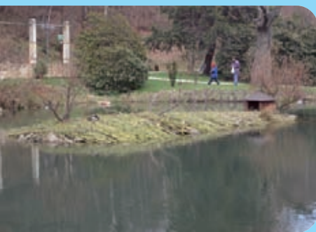
Abb. 18: Weidenspreitanlage mit austriebsfähigen Weidenruten in Jonsdorf, Landkreis Löbau-Zittau, April 2004