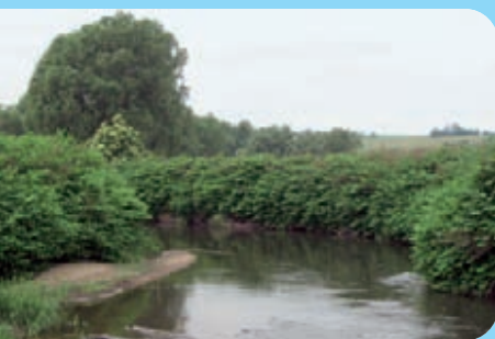
Abb. 11: Die Staudenknöteriche haben ihren Verbreitungsschwerpunkt an Fließgewässern, Neiße bei Ostritz