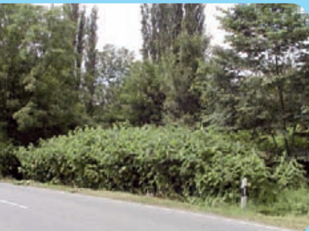
Abb. 13: Hochwüchsige Bestände der Staudenknöteriche am Straßenrand