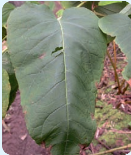
Abb. 5: Ausgewachsenes Blatt von Sachalin-Knöterich hat einen herzförmigen Blattgrund