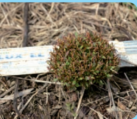
Abb. 25: Verkrüppelter Wuchs im Folgejahr nach Behandlung mit Glyphosat

Jeder scheinbar beseitigte Bestand muss noch in den Folgejahren kontrolliert werden. Gegebenenfalls müssen weitere Verdrängungsmaßnahmen erfolgen, bis der Boden frei von Knöterichrhizomen ist.