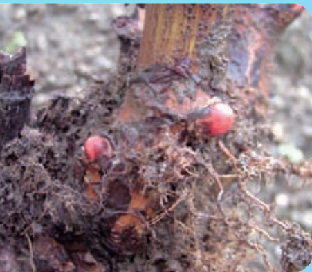
Abb. 7: Haupttrieb basis mit Bewurzelung und angelegten Erneuerungsknospen für den Sprossaustrieb im Folgejahr