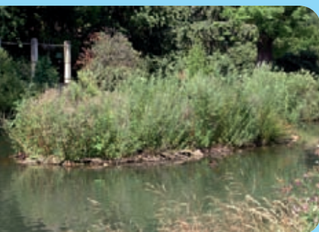
Abb. 19: Dichter Weidenaufwuchs verhindert das Nachwachsen des Knöterichs, Jonsdorf, September 2006