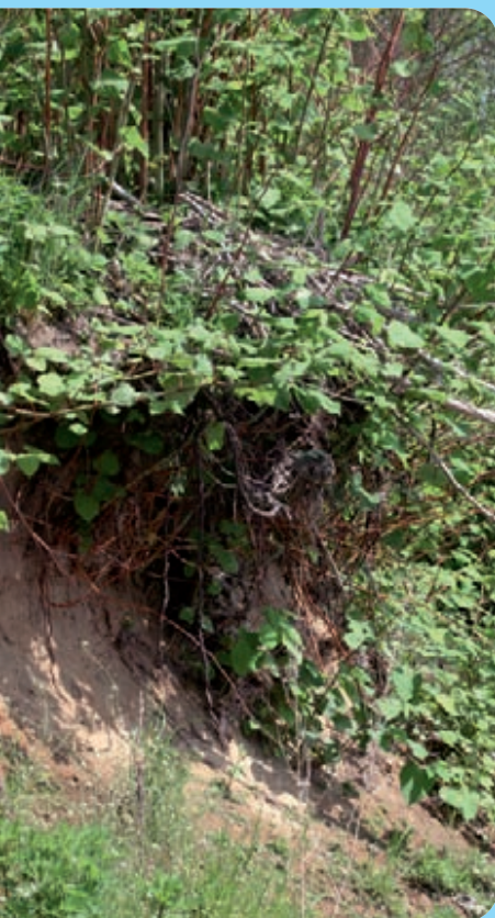
Abb. 17: Ufererosion auf einem Knöterichstandort an der Neiße bei Ostritz

Die Staudenknöteriche gehören zu den am häufigsten bekämpften Neophyten. Auf Grund ihrer weiten Verbreitung und der Dauerhaftigkeit ist eine völlige Ausrottung nicht realistisch und sinnvoll. Eine Bekämpfung in Naturschutzgebieten, in öffentlichen Grünanlagen, im Grünland und insbesondere an Gewässern sollte vorgenommen werden, wenn die Pflanzen dort Probleme verursachen. Entscheidet man sich für eine Zurückdrängung der Bestände, sollte möglichst frühzeitig mit Maßnahmen begonnen werden, bevor sich neue Bestände etabliert haben und ihre Entfernung aufwändig ist. Bei allen Methoden ist zu beachten, dass die Vermehrung und Ausbreitung über die Rhizome und/oder Spross- und Rhizomstücke erfolgen. Die bloße Vernichtung der