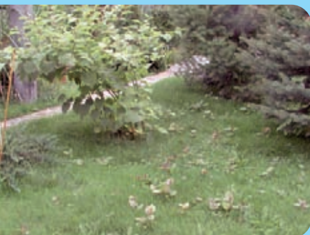
Abb. 14: Staudenknöterich im Garten, Verbreitung im Rasen