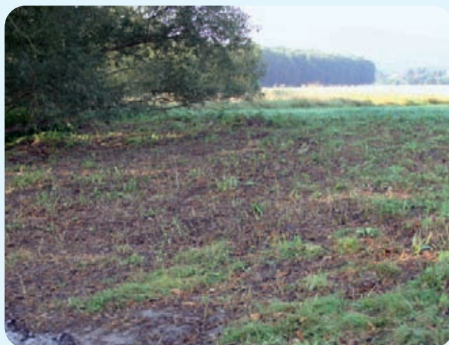
Abb. 23: Abgemähter Knöterichbestand vor der Behandlung mit Glyphosat, die Entwicklung anderer Pflanzenarten war kaum möglich, August 2004