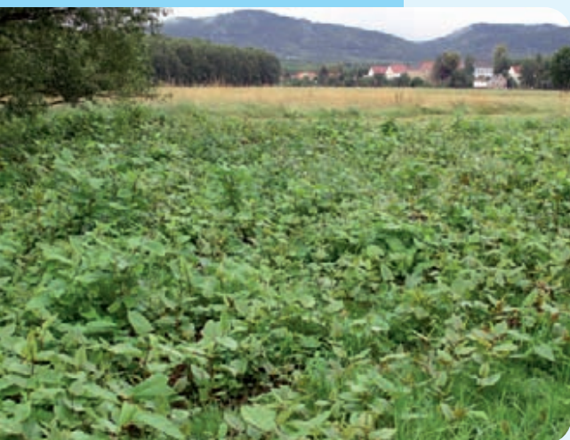
Abb. 22: Großflächiger Knöterichbestand vor der Behandlung mit Glyphosat, Landkreis Löbau-Zittau, Juli 2004