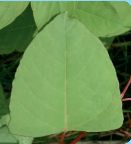
Abb. 4: Typische Blattform des Japanischen Staudenknöterichs mit gestutztem Blattgrund