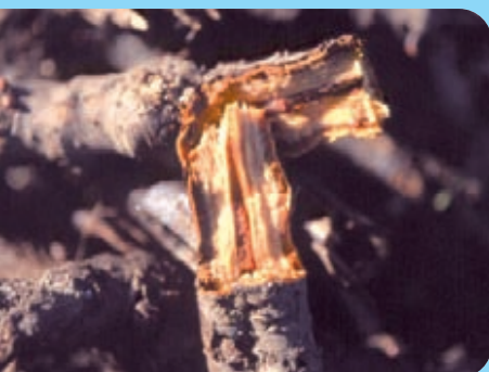
Abb. 21: Die Rhizome können leicht abbrechen

oberen Pflanzenteile führt nur bei häufiger Wiederholung dieser Maßnahme zur Zurückdrängung. Welche mechanischen und/oder chemischen Maßnahmen letztlich durchgeführt werden, ist von Fall zu Fall zu entscheiden. Hierzu gibt es folgende Methoden: