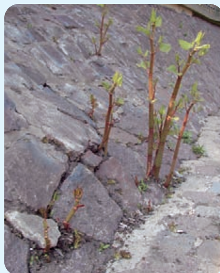
Abb. 16: Nach Hochwasser 2002 errichtete neue Ufermauer an der Weißeritz, Aufnahme Mai 2006

haben. Die dicken, feinwurzelnarmen Rhizome stabilisieren den Boden nicht genug. Zusätzlich findet man unter den dichten Knöterichbeständen kaum andere Pflanzen mit bodenfestigender Wirkung. Durch das Absterben der oberirdischen Sprosse nach dem ersten Frost ist der Boden fast kahl und kann leichter abgetragen werden als beim Vorhandensein eines naturnahen Uferbewuchses. Die dichten und harten Stängel der Knöterichpflanzen sind in der Lage, den Wasserabfluss zu hemmen und Treibgut zu fangen.