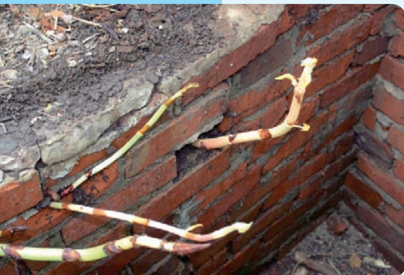
Abb. 15: Beschädigung der Mauer durch eine junge Knöterichpflanze