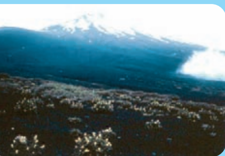
Abb. 1: Der Japanische Staudenknöterich kommt in seinem natürlichen Verbreitungsgebiet auf vulkanischen Aschefeldern vor, Mount Fuji Japan