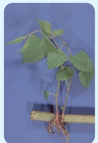
Abb. 9: Regeneration aus den Knoten eines Stängelfragmentes

Beide Arten sowie deren Hybride haben ein sehr großes Regenerationspotential . Ein sehr kleines Rhizomfragment mit Knospen kann zu einer neuen Pflanze austreiben. Durch das schnelle Wachstum im Frühjahr, den großen Wuchs und die Ausbildung dichter Bestände sind die Staudenknöteriche sehr konkurrenzkräftig . In der Hauptwachstumsphase (Mai) kann der tägliche Zuwachs 10 - 30 cm betragen.