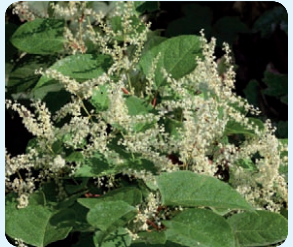
Abb. 6: Weiblicher Blütenstand von Japanischem Knöterich