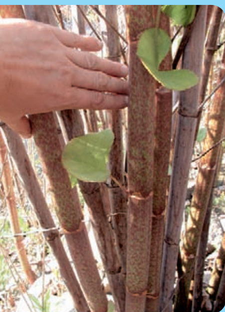
Abb. 2: Stängel der Staudenknöteriche sind oft rot überlaufen